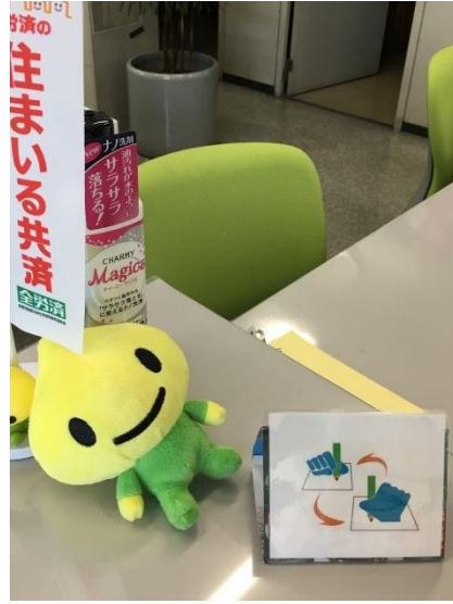
労働組合事務所の窓口で筆談マークを設置しました