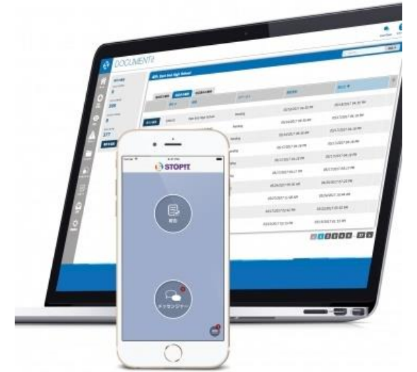
いじめ等の不適切な行為を報告・相談するアプリ「STOP i t」