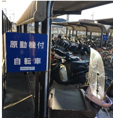
舞阪駅前自転車等駐輪場に原付2種125cc以下が駐輪。※原付1種と2種の車体はほぼ同じであり、条例を50cc以下から125cc以下に改訂しても問題はないと考える。