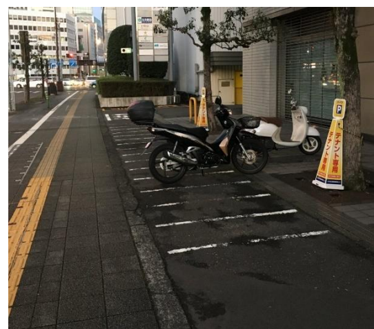
静岡市内の歩道横に設置された小規模駐輪場※125cc以下まで駐輪可能