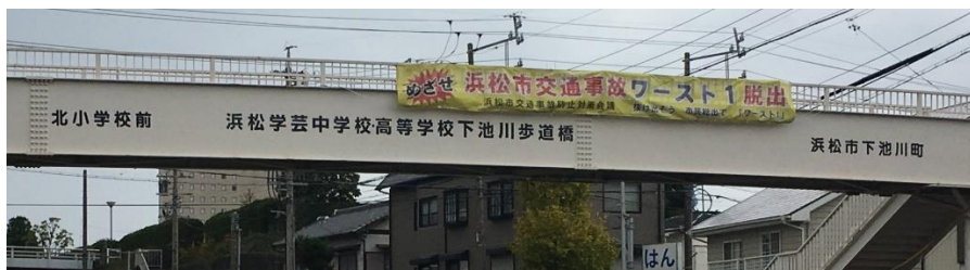
浜松市 浜松学芸中学校高等学校下池川歩道橋 契約料年額20万円以上（3年間）※対象歩道橋20橋中契約は1件のみ ※要綱では、文字の配置や書体等は歩道橋全体のバランスを損わないことや、文字色は単色など条件が厳しく広告要素が薄いのでは？