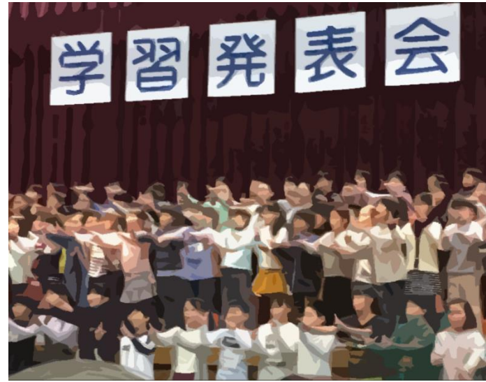
上島小学習発表会にて、4年生のユニバーサルデザインの学習成果を発表（合唱と手話）