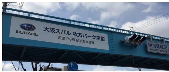
大阪府 大阪スバル枚方パーク店前 契約料年額30万円以上（5年間）※公募151橋・実施5橋 大阪市 マクドナルド古市大通歩道橋 契約料年額30万円（3年間）※公募148橋・実施21橋 歩道橋のネーミングライツは大阪府が平成22年に全国初で実施し、現在は45路線の橋梁129橋とトンネル30本を対象施設に拡大したが苦戦している。職員が施設近隣企業などに営業をしている。