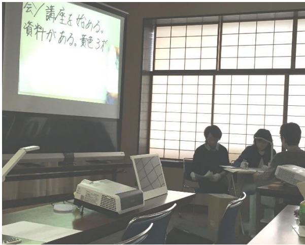
文字通訳「要約筆記」体験会に参加（手書き筆記・パソコン筆記）中途失聴など手話ができない方の対応など、難聴の理解が深まった