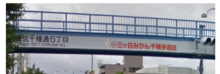
名古屋市 三ヶ日みかん千種歩道橋 契約料月額2万5千円以上（6年間）三ヶ日みかんは他に豊田歩道橋でも実施。公募307橋中実施87橋（実施率28.3%）※名古屋市の未対象歩道橋は17橋のみ。