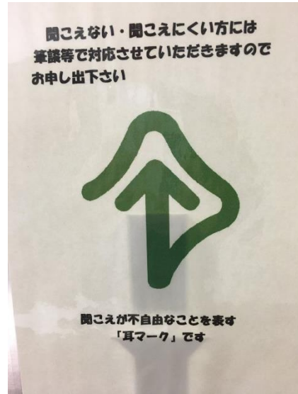
浜松市役所窓口を設置されている「耳マーク」