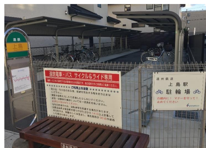
公共交通機関が設置したサイクル&ライド専用駐輪場。シェアサイクル駐輪場になれば公共交通機関の利用促進となる。