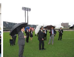
大型スポーツ施設調査特別委員会視察