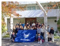
本田労組 組合員レク