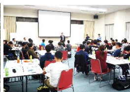
本田労組 役員研修会