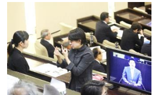
傍聴席に「要約筆記通訳者」「手話通訳者」がそれぞれ派遣された