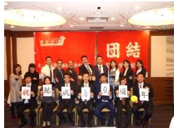
ホンダ開発労組結成50周年記念イベント