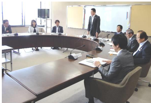
市民文教委員長として就任のあいさつ

浜松市議会第2回定例会が6月14日に閉会しました。主議案の補正予算では、保育所などの待機児童解消に向け、平成30年4月に開園予定の保育所整備に対する助成や、予想を上回る大河ドラマ館への来場者増加に伴う、来場者、地域住民の方々の安全確保に関する経費を追加しました。その他、「文化・環境分野等の協力関係の構築」といった覚書を締結しているインドネシア共和国バンドン市に対し「 漏水防止対策技術支援 」として上下水道部職員派遣に加え、バンドン市から本市への研修生受け入れに要する経費なども追加されました。今議会より私は市民文教委員会の委員長を拝命しました。当委員会は本市の教育施策、文化芸術やスポーツの振興政策などの事業について調査します。2期目の任期中であるH31までの2年間においては 教育文化会館(はまホール)の後継施設整備 や 放課後児童会の待機児童対応 など、本市にとって重要な事業に関わることとなりますが、多くの市民の声を反映しながら丁寧な委員会運営に努めてまいります。皆様の更なるご協力をお願いします。