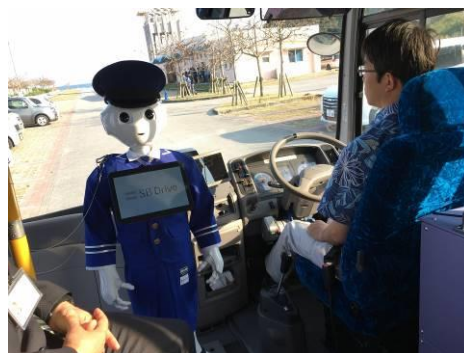
運行状況を案内するペッパー車掌