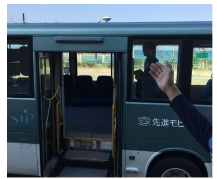
高精度測位(cm単位)の受信部